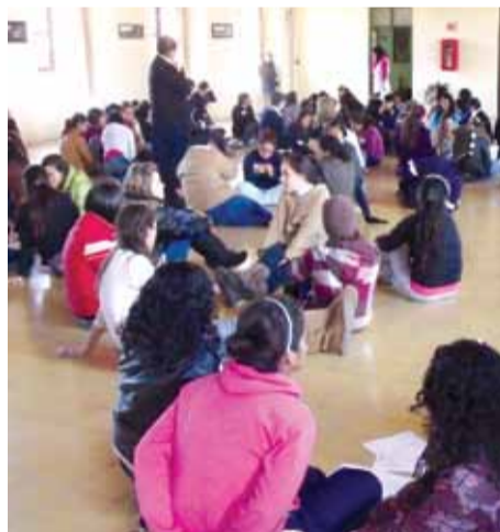
La convivencia dentro y fuera de la institución es fundamental para fomentar las enseñanzas de San Marcelino Champagnat.

«Nosotros asumimos en cierto modo desde esa perspectiva la herencia de Marcelino