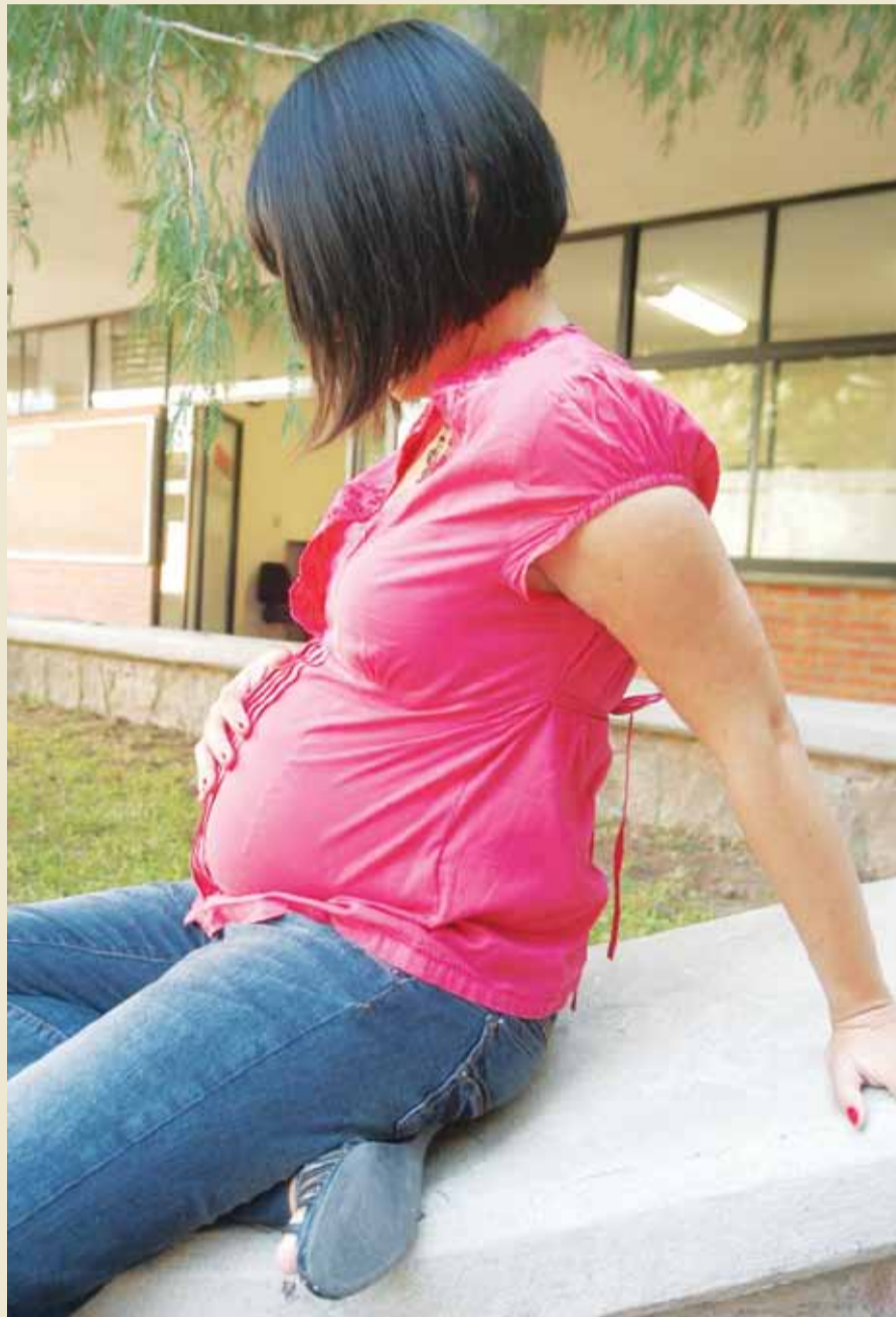
Por la falta de información siguen existiendo embarazos no deseados.

«Sexo seguro» es una opción para llevar una sexualidad sana y prudente basada en información científica que constantemente es actualizada.