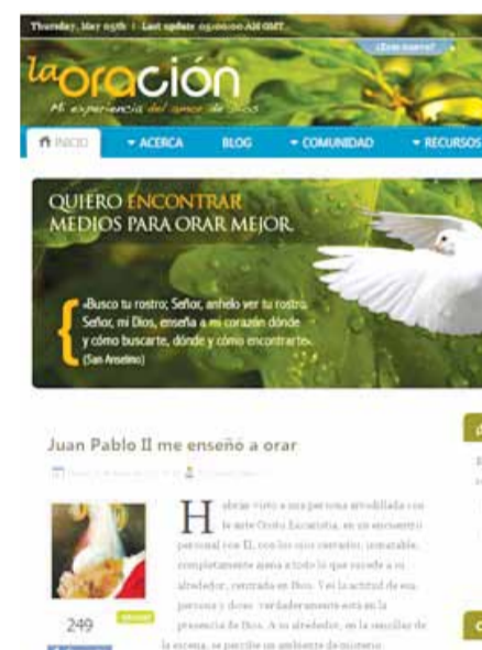
La finalidad de la-oracion.com no es atraer visitantes sino llevar a quien se quiere beneficiar de esta valiosa herramienta a un encuentro real con Dios.

Pero hay más. Es verdad que presentar este proyecto como una iniciativa en internet sobre la oración es un riesgo porque la temática misma no parecería suscitar inmediatamente un «interés mediático». Digamos que no es un tema que genere publicidad e incluso podría dar la idea de que es «algo únicamente para los que se la pasan en la Iglesia» o para los que ya saben orar... Y sí, también es para ellos, pero no sólo. Está dirigido a «quien quiera mejorar su comunicación con Dios», y en esto entran tanto principiantes como avanzados. Es, en definitiva, un recurso digital para despertar, confirmar y crecer en la vida de oración y, en este sentido, abierto a todos.